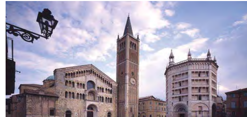
ECOSTARS Parma pociťuje velký zájem společenství italských dopravců.

Oficiální zahájení ECOSTARS v Parmě proběhlo v září 2012, ale podporu zúčastněných stran projekt získal již dříve. Řada podniků, jejichž vozový park zahrnuje téměř 4.000 vozidel, již schéma ECOSTARS v Parmě podporuje.