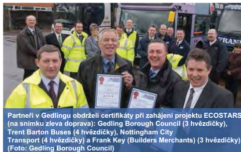
Partneři v Gedlingu obdrželi certifikáty při zahájení projektu ECOSTARS (na snímku zleva doprava): Gedling Borough Council (3 hvězdičky), Trent Barton Buses (4 hvězdičky), Nottingham City Transport (4 hvězdičky) a Frank Key (Builders Merchants) (3 hvězdičky).

Již další dva místní úřady ve Velké Británii se díky úspěchu konceptu nově zapojily v roce 2012 do systému ECOSTARS. Tato schémata využívají různých zdrojů veřejných prostředků pro hodnocení vozových parků na místní úrovni.