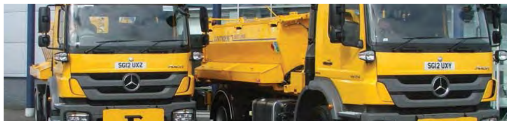
Dva nejnovější přírůstky městské flotily v Edinburghu: dva Mercedesy "Hot Box", které se používají pro přepravu a pokládku horkých materiálů na vozovky.

Tým ECOSTARS Edinburgh je příjemně překvapen kvalitou a množstvím nově přichozích členů ECOSTARS. Město Edinburgh zaregistrovalo i vlastní flotilu 741 vozidel.