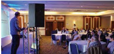
Na 7. konferenci Clearer Future (Čistší budoucnost) byli představeni a oceněni pětihvězdičkoví dopravci z hrabství Jižní Yorkshire. Foto z konference Čistší budoucnost.

Jižní Yorkshire ocenil na 7. konferenci „Čistší budoucnost: Kvalita ovzduší 2012“ dopravce, jejichž vozový park dosáhl ohodnocení pěti hvězdičkami ECOSTARS. Ocenění dopravci provozují relativně „nejčistší“ vozové parky, a tím zlepšují kvalitu ovzduší a kvalitu života obyvatel Jižního Yorkshiru.